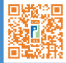
私隱專員公署 網頁