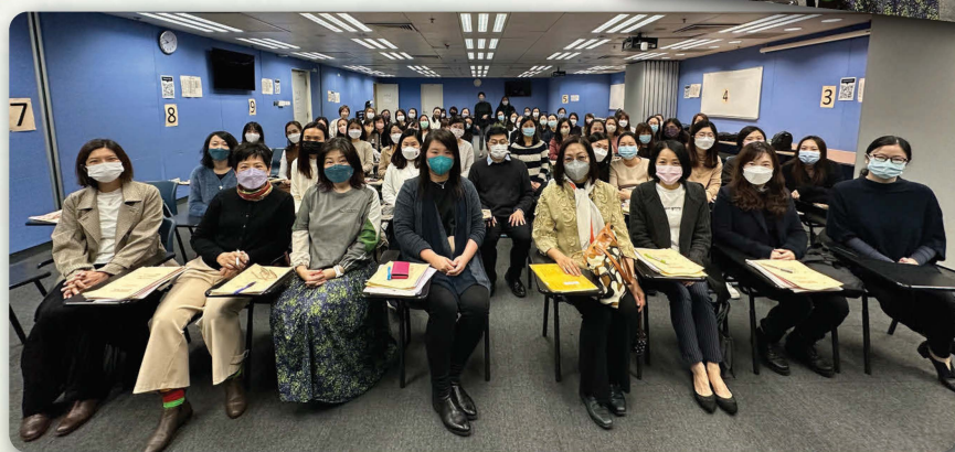
參加者及分享嘉賓大合照