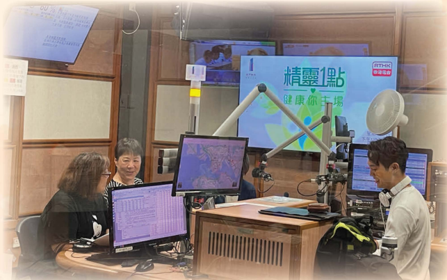
接受「精靈一點」@RTHK Radio 1訪問