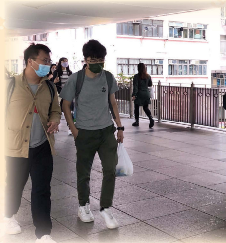
擺放海報於柯布連道行人天橋@灣仔