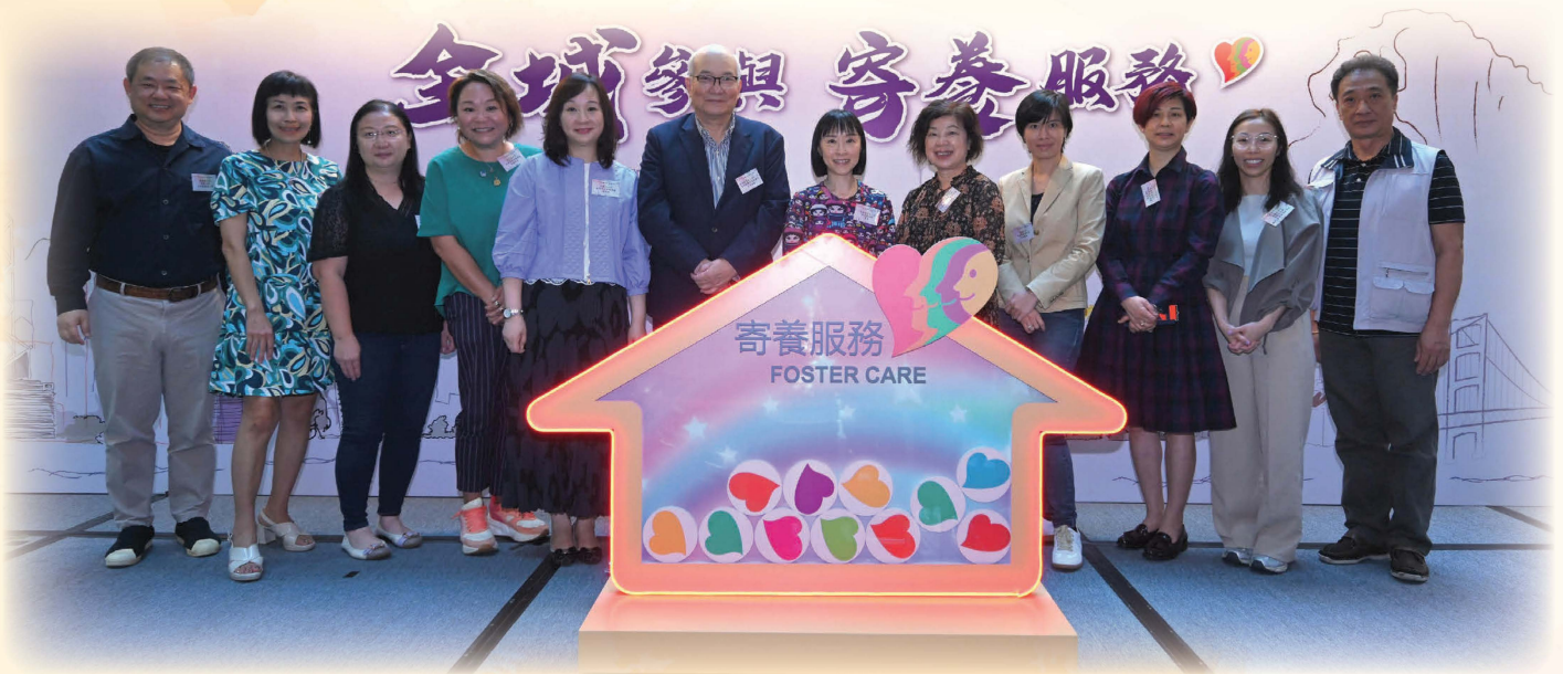
社署署長及嘉賓主持活動開展儀式