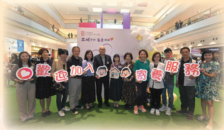
社署署長及嘉賓合照