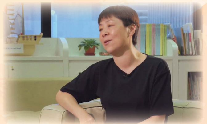
《社署服務暖社區》系列(第二集) - 寄養服務@香港開電視