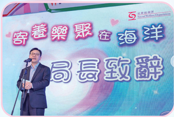
勞工及福利局局長孫玉菡致辭