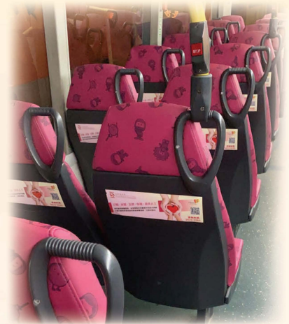
巴士椅背宣傳標貼