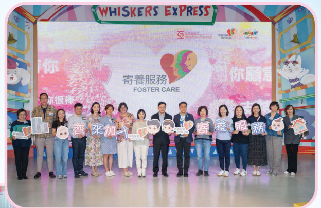
勞福局局長、社署署長及嘉賓主持活動開展儀式