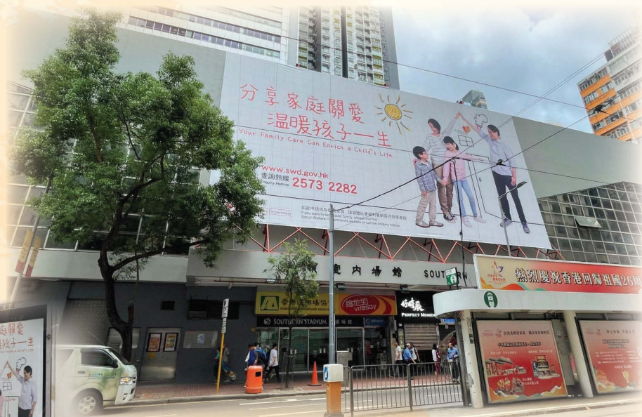
灣仔修頓中心外牆大型宣傳海報