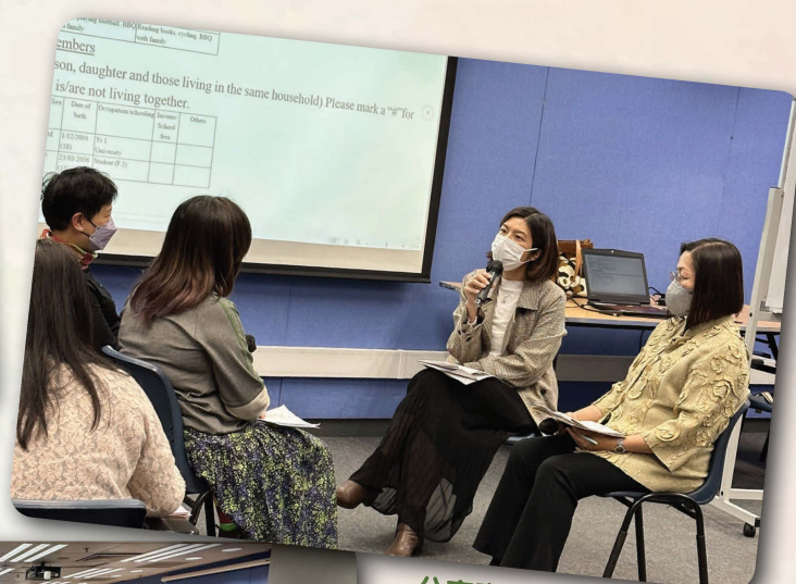
分享嘉賓及機構代表進行 角色扮演