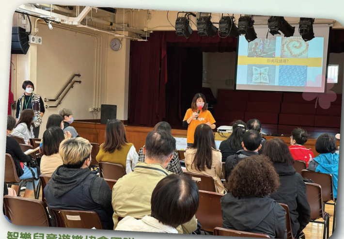
智樂兒童遊樂協會團隊