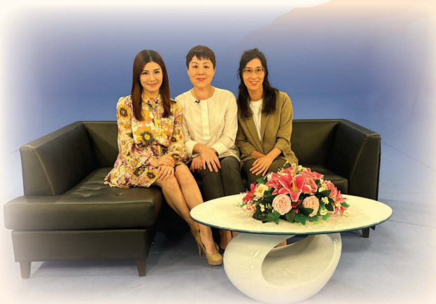
接受「快樂長門人」@TVB訪問