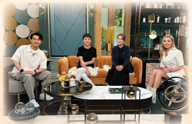
接受「流行都市」@TVB訪問