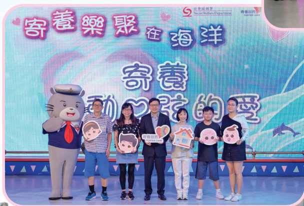
勞福局局長及參加者合照