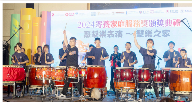
開幕表演氣勢磅礴