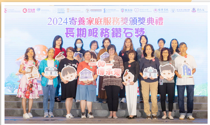
社會福利署助理署長（家庭及兒童福利） 鄒鳳梅女士 頒發長期服務鑽石獎 （服務年資達15年以上，20年以下）