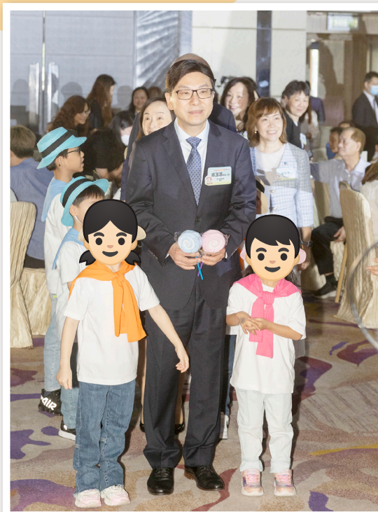
勞福局局長及嘉賓與寄養兒童攜手進場

勞福局局長及其他出席嘉賓，包括社署署長及各機構代表，與約700位寄養家長和寄養兒童歡敘，並向當中260個家庭頒發獎項，表揚他們對寄養兒童的關懷付出和非凡貢獻，同時鼓勵更多有心人加入寄養服務，將關愛傳送至更多有需要的兒童。