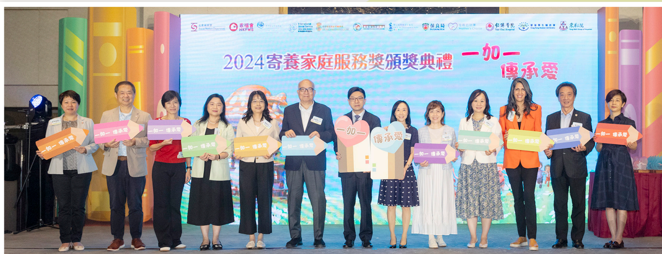
社署和11間寄養機構代表合照， 以「一加一 傳承愛」為主題，推廣「1+1」組合寄養家庭招募模式