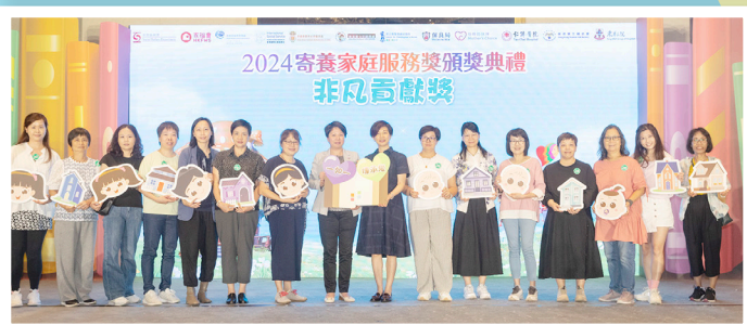
寄養服務機構代表頒發「非凡貢獻獎」