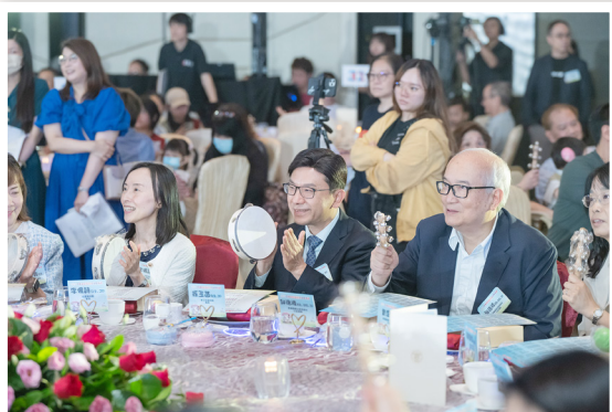
全場大合奏，樂也融融