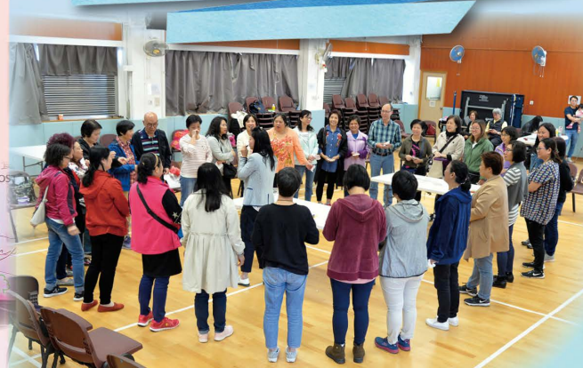
本署臨床心理學家帶領寄養家長處理壓力的方法

「寄養服務綜合培訓課程 (2018-19)」已於 2018 年 9 月至 2019 年 1 月順利舉行。該課程由 4 節核心課程及 1 節選修課程組合而成。核心課程內容包括從神經心理學角度，了解兒童的行為以及與他人的依附關係，從而掌握兒童身心靈的需要，讓寄養家長在日常相處及照顧寄養兒童更有果效。課程亦關顧到寄養家長在照顧兒童時所面對的壓力，在課程中他們有互動機會，分享遇到的困難及情緒反應，並認識處理壓力的正確方法。為了讓寄養家長認識、掌握和更有效照顧有特殊教育需要的兒童，我們也安排了選修課程，探討有關這類兒童的特性、誤解及事實。是次寄養服務綜合培訓課程於沙田區舉行，有四十多位寄養家長完成綜合培訓課程；他們對課程作出非常正面的評價。