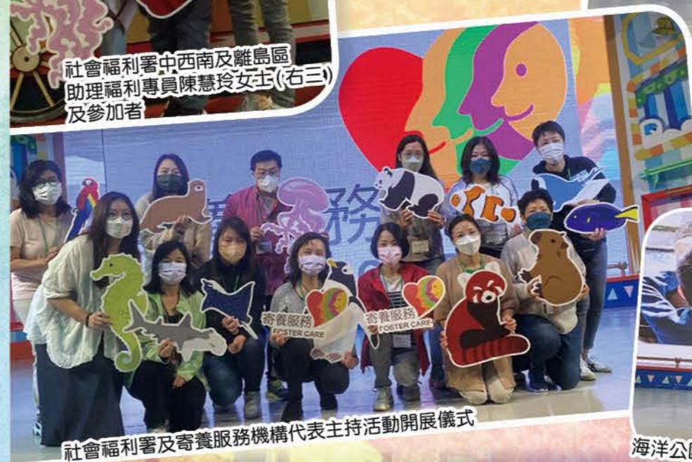
社會福利署及寄養服務機構代表主持活動開展儀式