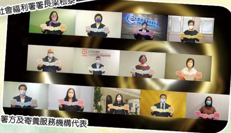
署方及寄養服務機構代表