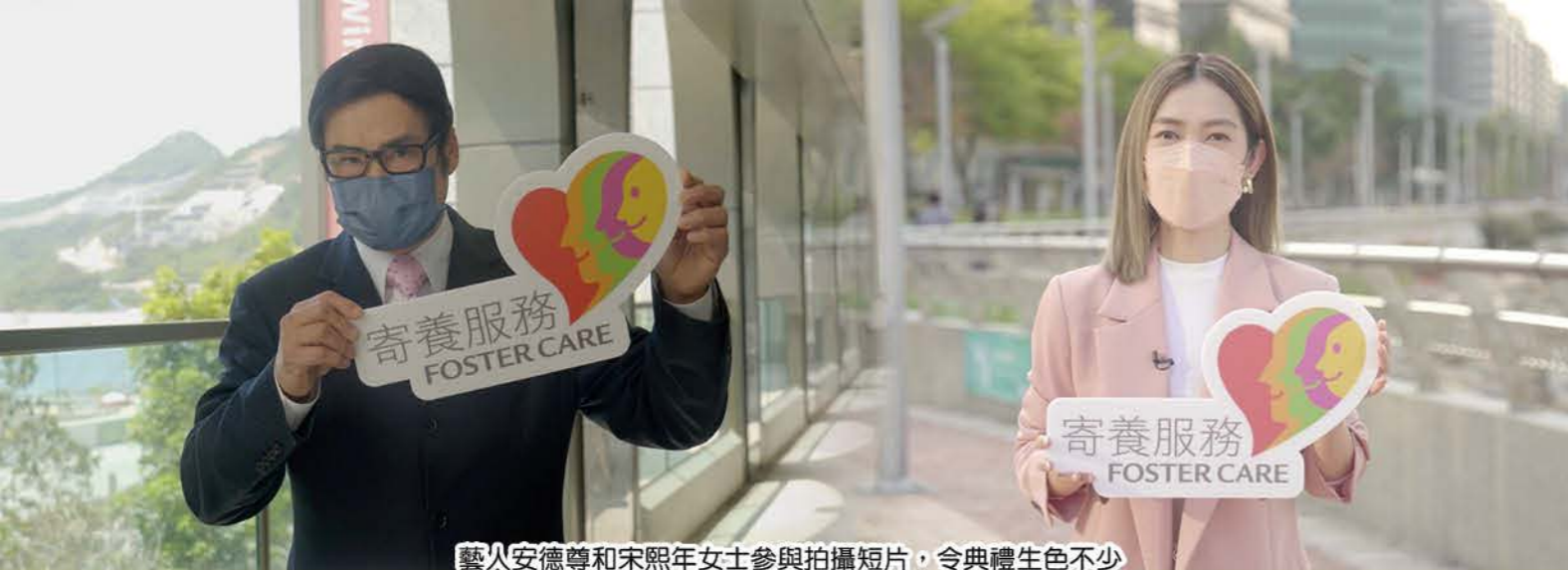
藝人安德尊和宋熙年女士參與拍攝短片，令典禮生色不少