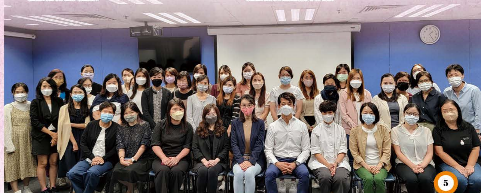
參加者及講者大合照