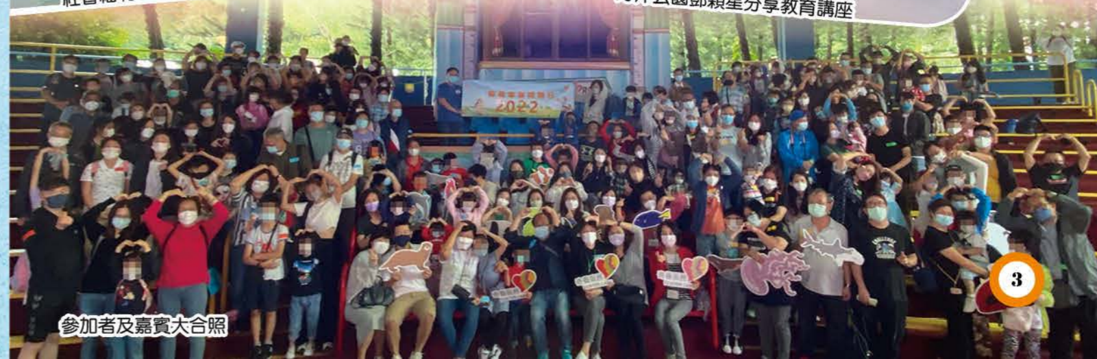
參加者及嘉賓大合照