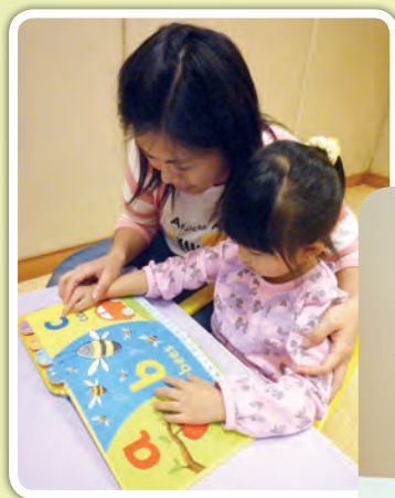
家長與幼兒一起閱讀 字母圖書