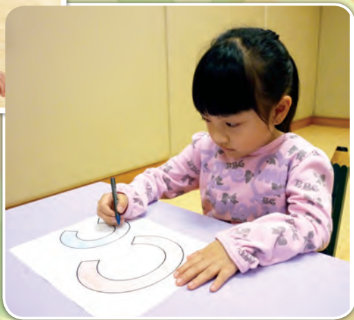
小肌肉活動：握筆填色 (Colour)