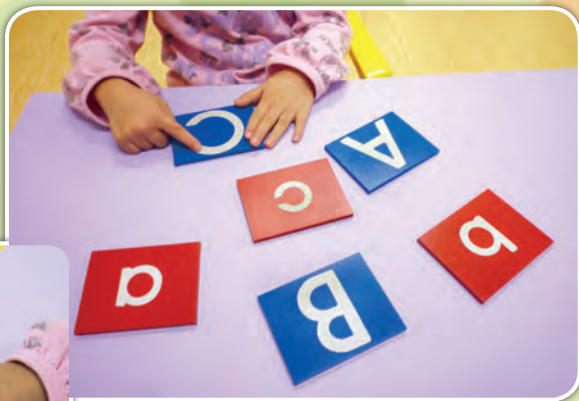
幼兒用手指觸摸沙紙字母板來學習字母的字形