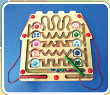
模擬寫前線條活動