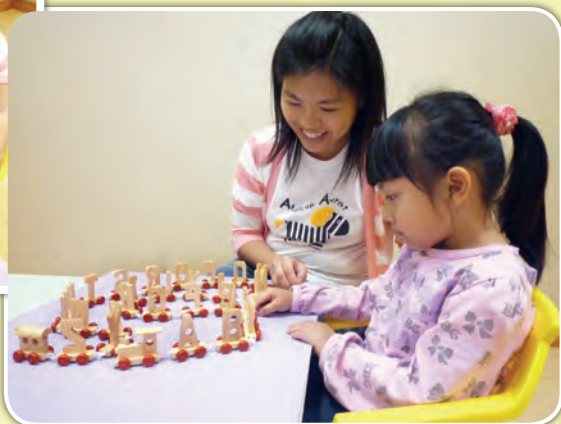
家長與幼兒一起拼砌字母火車