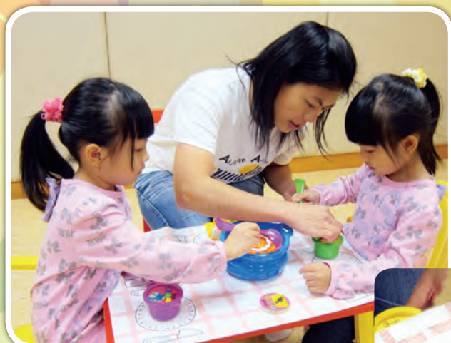
社交 / 自理活動：一起用匙舀字母珠粒來學習英文生字，例如： “cat”（貓）