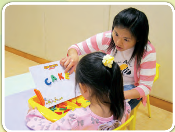
智能 / 語言活動：學讀英文生字“CAKE”（蛋糕）