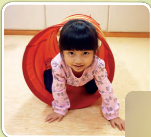
大肌肉活動： 爬越 (Crawl) 隧道

在家居裏設立英語學習角，可增添學習氣氛，培養幼兒學習英文字母和相關詞彙的興趣。在學習角裏，可擺放英文字母海報，英文故事書、播放英文兒歌等；亦可因應幼兒各方面的能力發展而設計及進行多元化的訓練活動來擴闊他們的英語領域。以下是學習角裏有關英文字母 C 的活動範例，供參考之用。