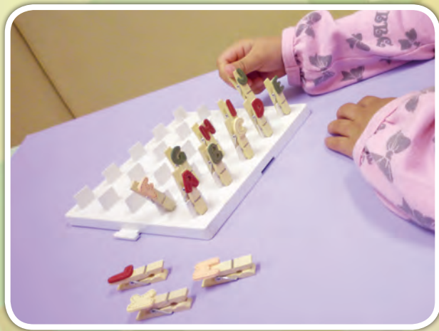
幼兒將字母書夾夾在膠板上