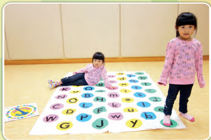
朋輩一起玩字母扭扭樂遊戲