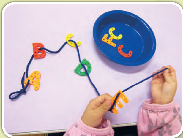
幼兒用繩串連字母形狀膠塊