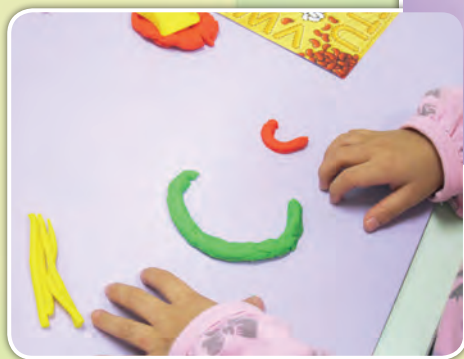
幼兒用手將黏土捏成字母