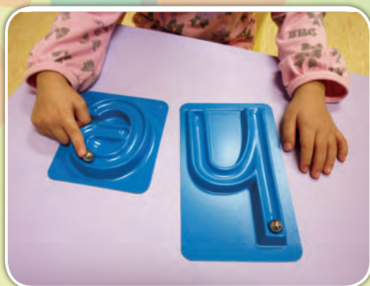
幼兒觀察字母板上的滾動鋼珠來學習字母的筆順