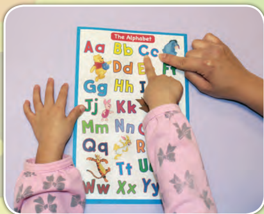
幼兒觀察大小楷英文字母表