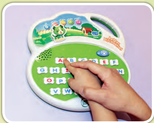
幼兒按動字母發聲器來聆聽字母的讀音和字母歌