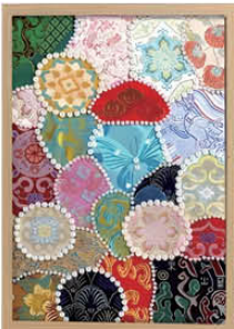
(圖片只供參考，以活動製成品為準)