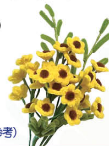
(網上圖片僅供參考)