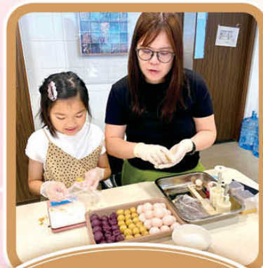
快樂童萌 - 親子冰皮月餅班