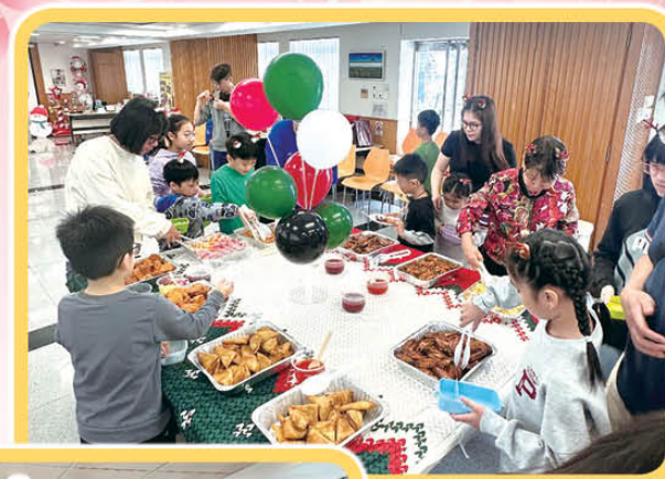
書送快樂生日派對 (12-3月)