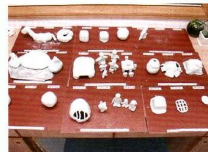
組員的陶泥作品：昨日、今日、明日